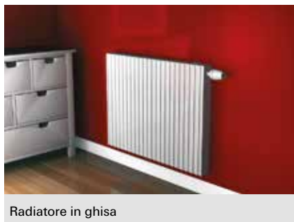
Radiatore in ghisa